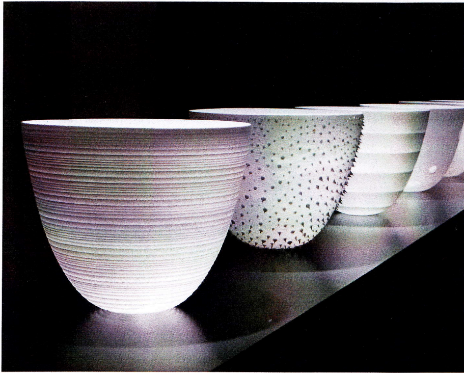
Arnold Annen, Bowl-Variationen .