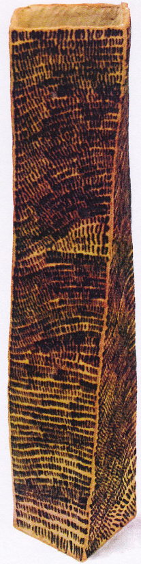
Michael Messerli, Tigers Power , 2012. Steinzeug schamottiert, Kupferoxyd, 104 cm.